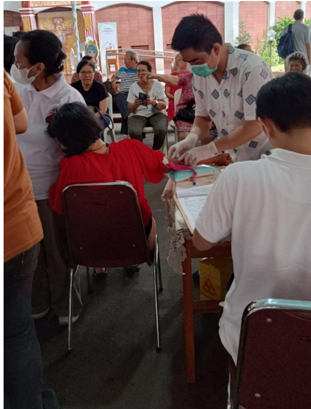
Gambar 1. Pengambilan Darah pada Masyarakat

Kegiatan pengabdian masyarakat ini dilaksanakan dengan menggunakan pendekatan Plan-Do-Check-Action (PDCA) sebagai kerangka manajemen mutu untuk memastikan keteraturan, efektivitas, serta kesinambungan program skrining fungsi hati melalui pemeriksaan SGOT dan SGPT. Pendekatan ini dipilih karena mampu mengintegrasikan aspek perencanaan, implementasi, evaluasi, dan tindak lanjut secara komprehensif, sehingga kegiatan tidak hanya menghasilkan data laboratorium, tetapi juga memberikan dampak promotif dan preventif terhadap peningkatan kualitas hidup masyarakat.